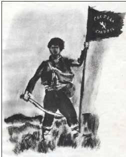
(Изображение на бунтовник)

За тоз глас ми копней душата, и там тегли сърце ранено, там, де е се с кърви облено!