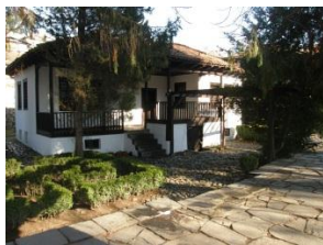
(Картина на Ботевата къща)

„ Хаджи Димитър“ http://www.slovo.bg/showwork.php3?AuID=1&WorkID=3158&Level=1